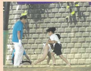
暑さも忘れて声援を送りました

今年の梅雨は本当に短かったですね。梅雨明け最初の日曜日、朝から30℃を超える炎天下、「子どもすもう大会」の応援に行ってきました。まず、会場の新羽小学校にある立派な土俵にビックリ。幼稚園の可愛い“ちびっ子”から体の大きな小学生まで、熱戦が繰り広げられていました。感想は“女性強し”・・・勝っても負けても感情がストレートに出ていました。この土俵から、将来、どんな力士が育つのでしょうか。今から楽しみです。 (7月1日)