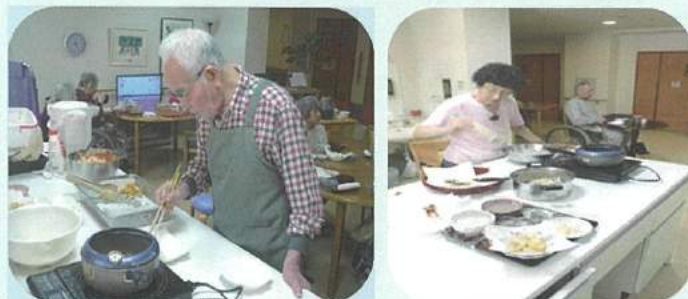
ご利用者やご家族の皆さまも手伝って下さいました

“大好きな天ぷらをあつあつで食べたい”との声を受けて、厨房の調理師がユニットへお邪魔し目の前で天ぷらを揚げました。パチパチとした音や立ち昇る匂いに食欲がそそられますよね。あつあつの天ぷらをサクサクッ。普段はあまり召し上がらない方もおかわりをしていました。次は何が食べたいですか？リクエストをお待ちしています。