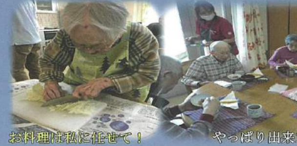
お料理は私に任せて！