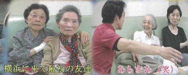
横浜に来て最初の友達