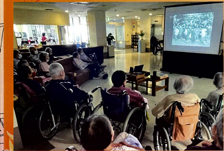
当時のニュース映像をシンクロさせると、記憶もより鮮明に

スタートのきっかけは、地域の方々からの沢山のご寄付でした。食糧難からの戦後復興、経済成長に子育ての日々・・・流行歌が流れる度に“あの頃”の記憶が蘇り、音の空間を漂うノイズさえ心地よく感じられます。ご入居者お一人お一人が懸命に駆け抜けた「激動の昭和」歌だけではなく、当時の思い出も興味深く聴かせてもらっています。