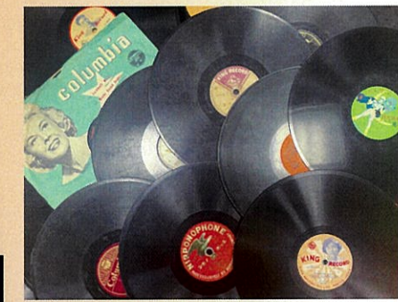
戦前戦後における名唱の数々・・・地域の皆様ありがとうございます