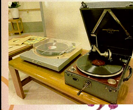
蓄音機コンサートも開催予定♪