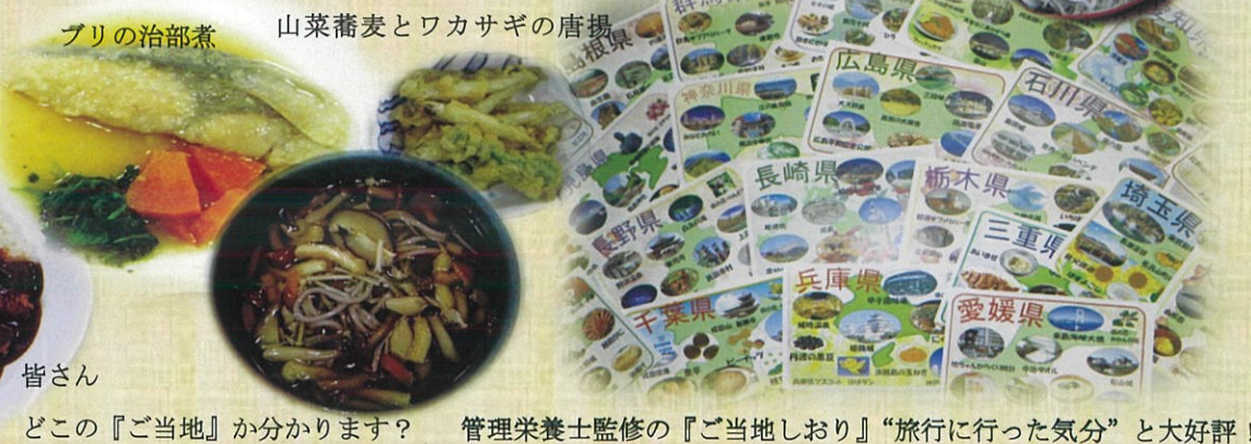
皆さん、どこの『ご当地』か分かります？ 管理栄養士監修の『ご当地しおり』“旅行に行った気分”と大好評！

毎月15日は『ご当地メニューの日』平成27年から開始し足かけ4年。ついに47都道府県を制覇しました。郷土料理からB級グルメまで、これからは味めぐりの旅が続きます。