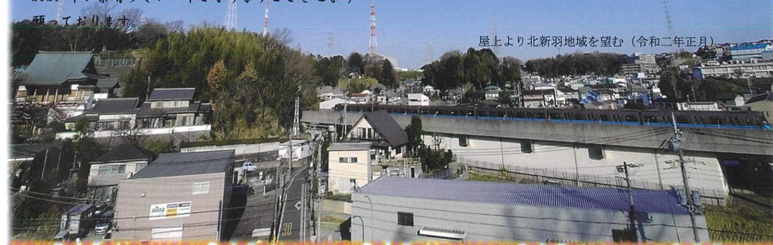
屋上より北新羽地域を望む (令和二年正月)