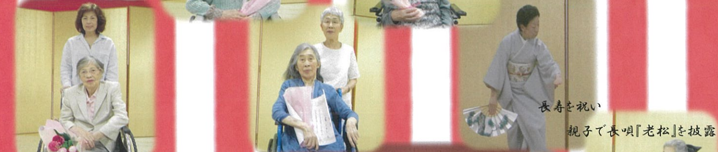
長寿を祝い 親子で長唄「老松」を披露