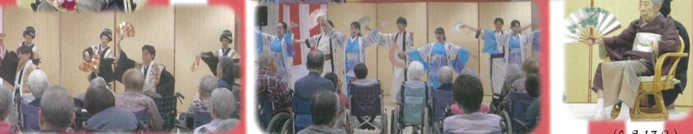
毎年恒例、「舞踊団正藤」による祝賀公演